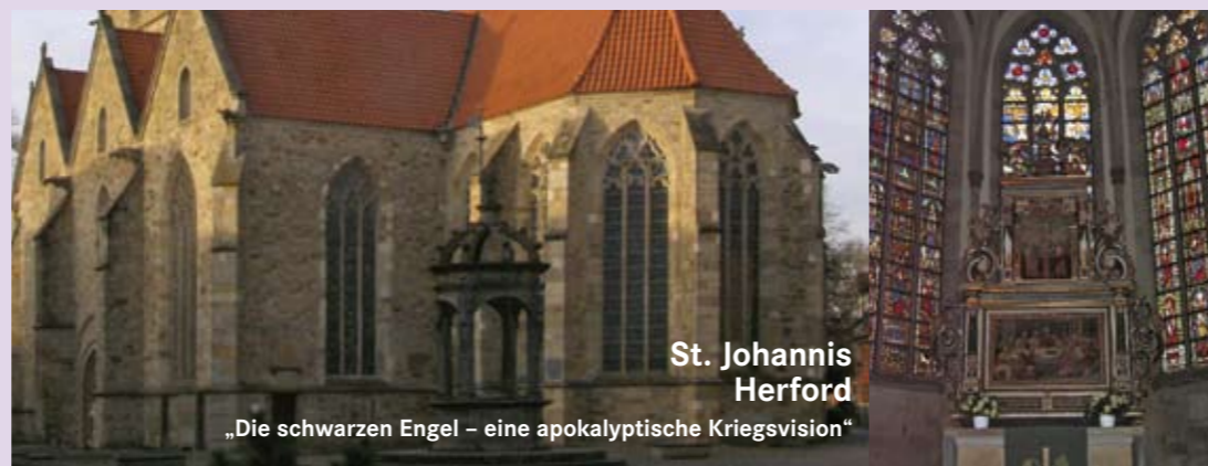
St. Johannis Herford „Die schwarzen Engel – eine apokalyptische Kriegsvision“