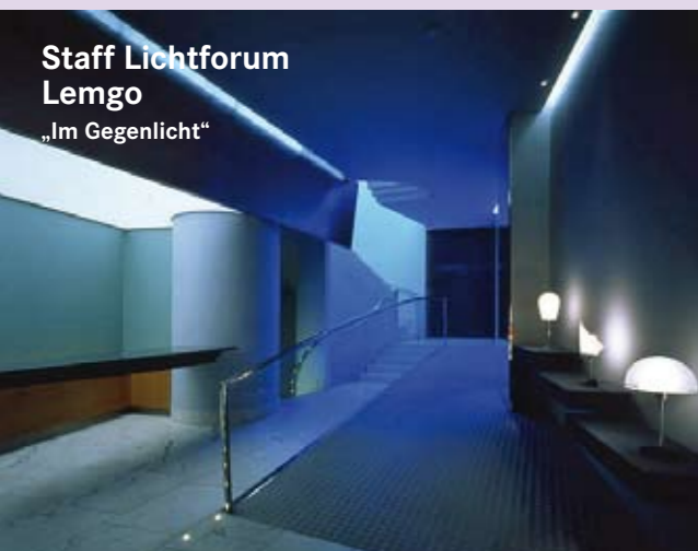
Staff Lichtforum Lemgo „Im Gegenlicht“

10.00 Uhr | Weserrenaissance-Museum Schloß Brake, Lemgo Werke von Maurizio Cazzati: „Ciaccogna“ für Violine, Viola und Harfe; Malika Kishino: „Lamento“ für Violine und Viola und Claudio Monteverdi: „Pur ti miro“ für Violine, Viola und Harfe