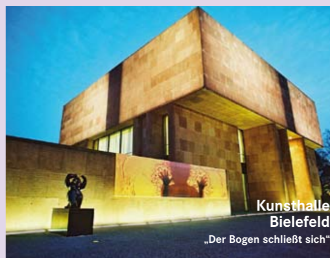
Kunsthalle Bielefeld „Der Bogen schließt sich“