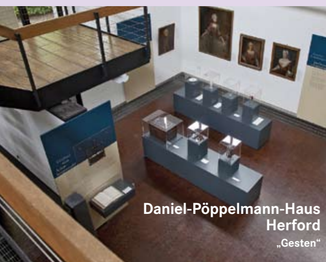
Daniel-Pöppelmann-Haus Herford „Gesten“