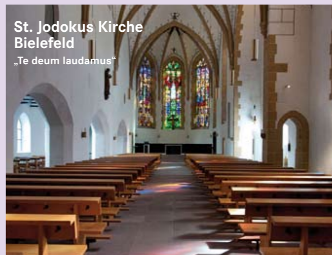
St. Jodokus Kirche Bielefeld „Te deum laudamus“

Ausführende der beiden Exkursionen: Mitglieder des Ensembles Horizonte, Vokalensemble ColVoc und Friedhelm Flamme; Orgel.