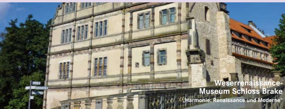
Weserrenaissance- Museum Schloss Brake „Harmonie: Renaissance und Moderne“